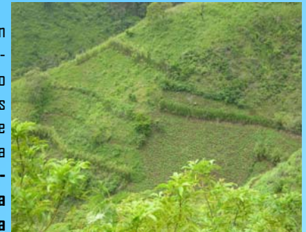
Ladera del Municipio de Cusmapa sembrada con Fríjol.

Ya se han firmado Acuerdos con diferentes instituciones nicaragüenses para comenzar acciones entorno al fortalecimiento de capacidades locales, seguridad alimentaria, e infraestructuras como son la propia Municipalidad de Cusmapa , el Instituto de Formación Permanente , la Universidad Nacional Agraria , la Universidad Nacional de Ingeniería y la UNAN-Leon .