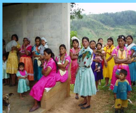
Grupo de mujeres Chortis. Municipio de Jocotán

La UPM ha facilitado un fondo semilla para comenzar actividades en el área (Escuelas de Campo de Agricultores) y las contrapartes los medios técnicos y humanos para apoyarlas.