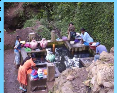
Mujeres de la Microcuenca "La Mina" de Jocotán lavando la ropa en la pila común.