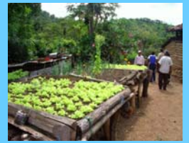
Semilleros de hortalizas en el patio de un hogar de Cusmapa, Nicaragua

No se trata de aumentar de manera "espectacular" las condiciones de vida de unos pocos. Sino de trabajar desde el inicio para que muchos, y de manera rápida , alcancen el primer peldaño que les permita subir por si mismos, y gracias a sus capacidades, la escalera del desarrollo.